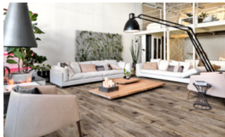
Kollektion: Impression 9 Realistic, Dekor: Eiche Nordic | Collection: Impression 9 Realistic, Dekor: nordic oak

ness and different plank formats, from narrow to XXL, is divided into only two basic collections – "Style" and "Authentic". The range of usage classes extends from 31/AC3 to 33/AC5, and the corresponding guarantees extend from 15 to 20 and up to 25. Unlike the Style collection, whose floorings have an all-over texture, the decors of the "Authentic" collection have high-quality synchronous textures.