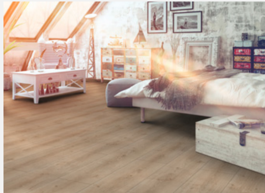
Kollektion: Home 8 V largo, Dekor: Eiche natur | Collection: Home 8 V largo, Decor: oak natural.

Gruppe ihren Handelspartnern die individuelle Sortimentserstellung und positioniert sich damit deutlich als verlässlicher Partner des qualifizierten Handels.